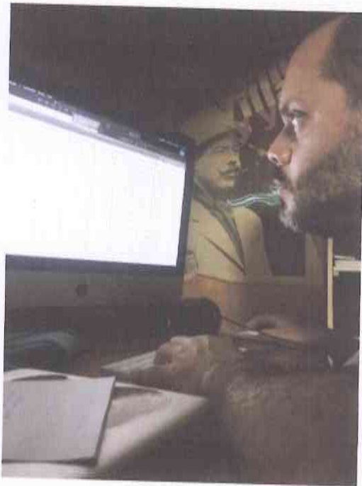
Durante el proceso de visualización y selección de tomas.

Revisión y selección final de tomas de video y audio para proceso de sincronización y edición junto a editor. (adjunto documento "Roza Selección de tomas buenas ")