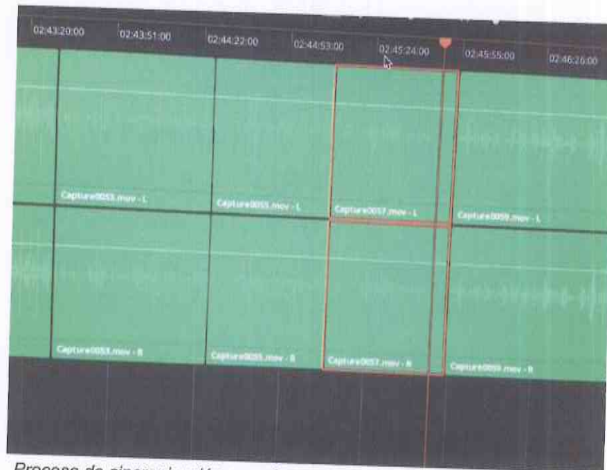
Proceso de sincronización en software de edición.